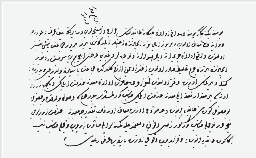
III. 3 Výnos sultána Selima II z roku 1574 (Marushiakova / Popov 2001, str. 33) (Detail)